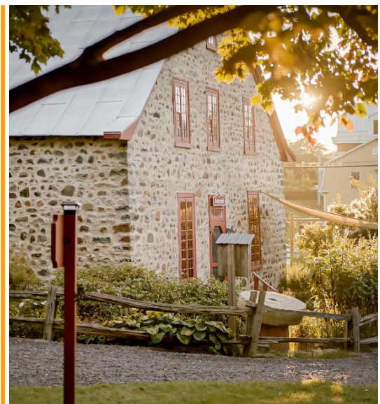
Moulin seigneurial de Pointe-du-Lac - Trois-Rivières, Québec