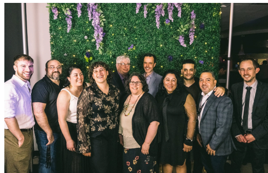
Comité congrès 2025

Merci au comité congrès 2025 pour son engagement !