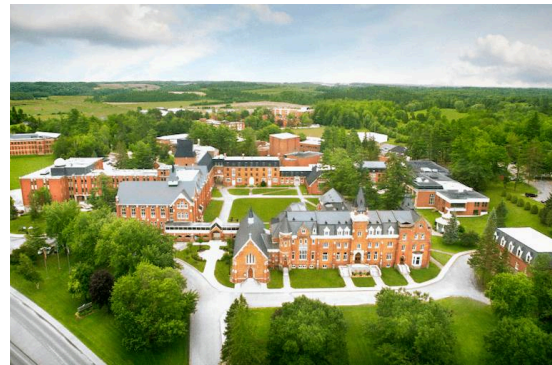
Université Bishop